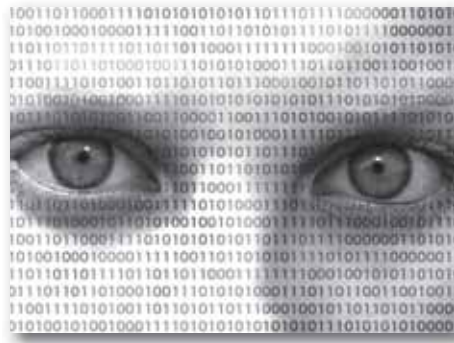
bild der Beschwerde gegen die Vorratsdatenspeicherung der Kommunikationsdaten, möglichst viele Bürger beteiligen sollen.

Der FoeBuD e. V. (Verein zur Förderung des öffentlichen bewegten und unbewegten Datenverkehrs) hat nun eine Verfassungsbeschwerde gegen ELENA vorbereitet, an der sich, nach dem Vor-